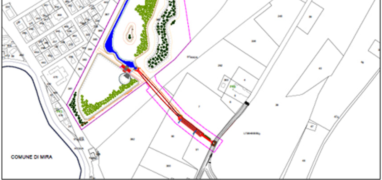
2091-2023 planimetria parco del bacino di Malcontenta-2